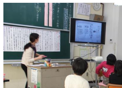
公開授業の様子(4年生)

児童による自己解決や学び合いをねらいとして意図的にグループを作り課題解決させた。児童が叙述に即して読み取れるように、授業者が教材文を打ち直し、文章全体を把握しやすいようにした。グループ学習では、読み取ったことを伝え合いながら、図や文にまとめさせた。児童の考えを交流する際はタブレットを活用し、その場で画面に写して見合うことで理解の深まりをねらった。和紙のよさや筆者の意図を読み取ろうとする意欲的な姿が多くの子に見られた。