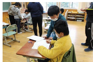
公開授業の様子(3年生)

同じ2分の1でも、何を1とするかによって、実際の大きさが異なることを発見・理解することをねらいとした。単元計画段階から、児童に数量的な感覚を伴って理解させるために、指導計画を見直して、授業の内容を入れ替えて実施した。本時は、ユニバーサルデザインを意識した板書やワークシートを工夫することで、児童にとって分かりやすく、自分の思考過程や分数が表す量を実感できるようにした。