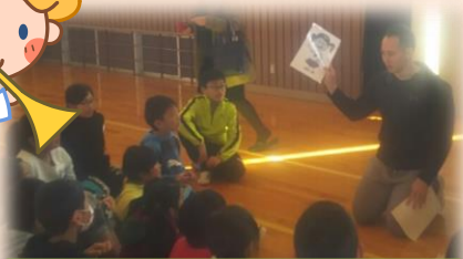
12月6日 吉田西小での 国際交流授業にて