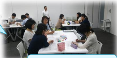
レッスンプランづくり

3つの評価の観点から、本時の目標や評価規準（本時で目指す子どもの具体的な姿）を考えました。