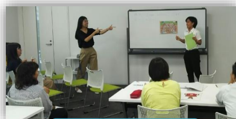
デモ・レッスンの様子

導入（Small Talk）場面でのALTとの会話や予想される児童の反応を書き出すことで、具体的な授業の流れのイメージをもつことができました。