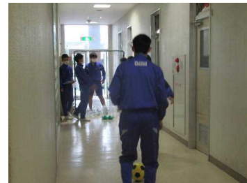
【ペットボトルホーリング】