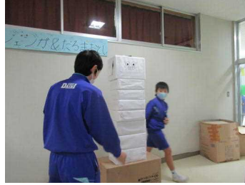
【ジエンカ・だるまおとし】