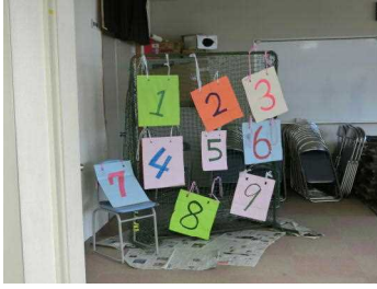
【テニスボールストラックアウト】