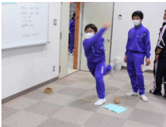
【ペットボトルホーリング】