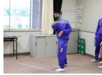
【テニスボールストラックアウト】