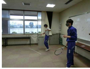
【テニスボールストラックアウト】