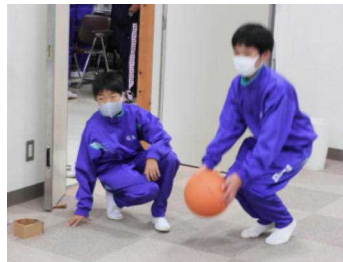
【ペットボトルホーリング】