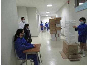
【ジエンカ・だるまおとし】