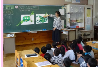
特別の教科道徳の授業