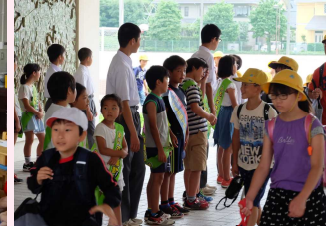
小中交流あいさつ運動