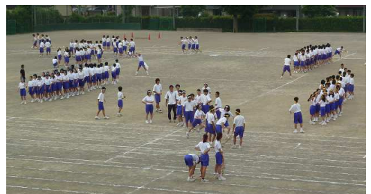
縄跳びの他に、百足競争、リレーなど練習の種目も増えました。