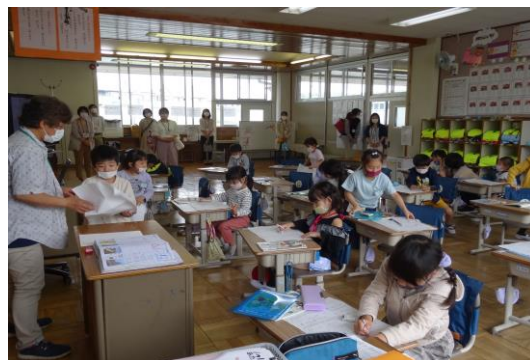
初めての授業参観：1年生