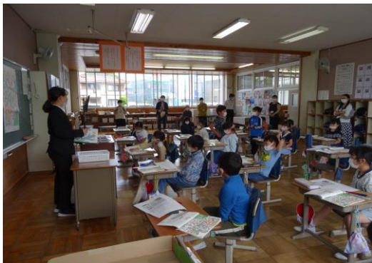
初めての授業参観：初任の先生

授業参観いかがでしたか。地区別に実施しました。多くの保護者の皆様に来ていただき、子どもたちもはりきっていたようです。学校と家庭の連携を強くして、子どもたちのより良い成長を支えて参りたいと思います。どうぞよろしくお願いいたします。