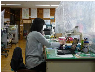
職員室の飛沫防止シート