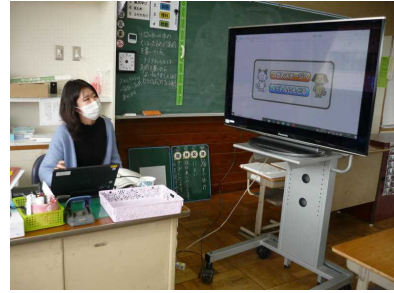
わかりやすい授業のための教材研究