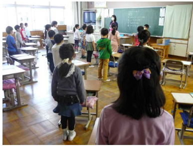
2年2組 朝のあいさつ