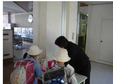
検温の確認・消毒

* 登校前に水道を開栓しておいたり、教室の清掃をしたり、配布物を分けておくなどの準備もしています。