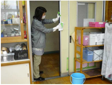
教室等のドア、窓、机等の消毒

学校では先生たちが、子供たちが感染予防や分散登校のための対応や工夫をしています。