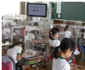
パーテーションを使った授業