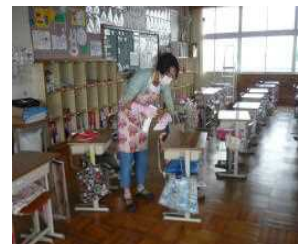
机等の消毒の様子