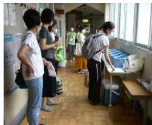
消毒ボランティアの皆さん