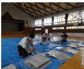
パーテーションの組立て

また、7月3日から放課後、学校支援ボランティアの皆さんが教室の消毒をしてくださっています。火曜日と金曜日、活動していただきます。毎日、放課後、教職員が児童が使用した教室やトイレの消毒をしていましたが、2日間ご協力いただき、教職員一同、消毒ボランティアの活動にとっても感謝しています。