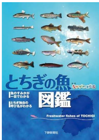
・とちぎの魚図鑑 487/ナ