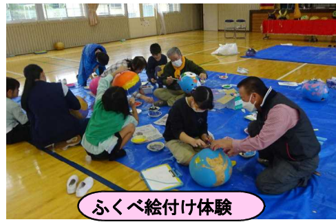
ふくべ絵付け体験