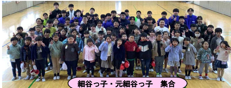
細谷っ子・元細谷っ子 集合