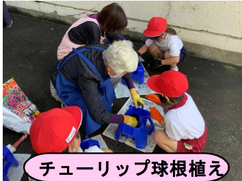
チューリップ球根植え