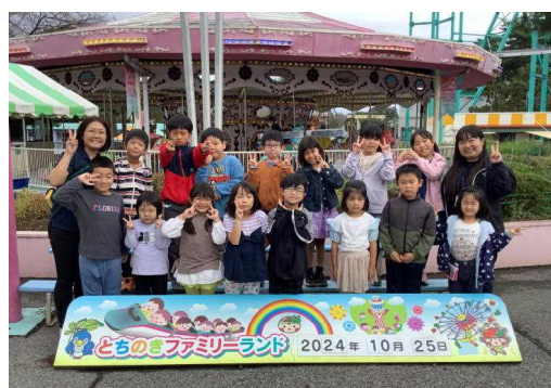
どちのファミリーランド 2024年10月25日