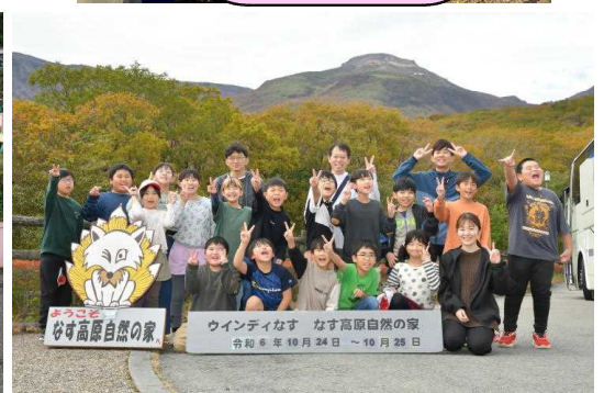
ウィンティなす なす高原自然の家 令和6年10月24日～10月25日