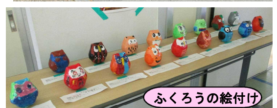
ふくろうの絵付け