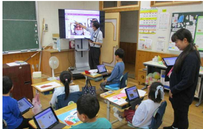
情報教育アドバイザーの授業