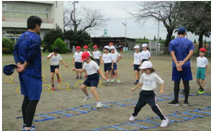
体力向上エキスパート事業