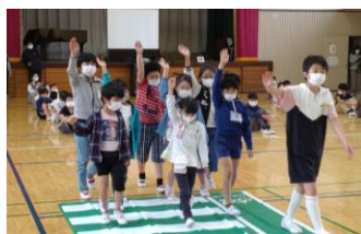
しっかり手を上げて、運転者に見せよう！