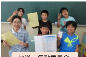
放送・運動委員会