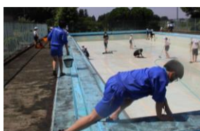
職場体験の中学生もお手伝いしてくれました