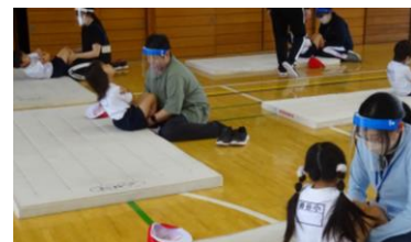
他学年の友達の前を見て、応援の代わりに大きな拍手がわき起こりました

子どもたちによる清掃とともに、親子奉仕活動で保護者の皆様や地域の消防団の方々にきれいにしていただいたプール。毎日、子どもたちの嬉しそうな声が聞こえてきます。自分のめあてにむかって、一生懸命にそして楽しそうにチャレンジしています。