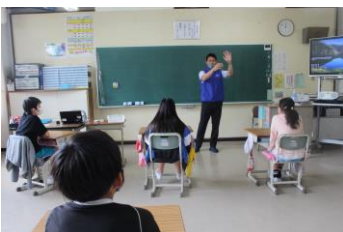
薬物は自分を減ぼす・・・

6月は、「自分の命」について考える取組が多くありました。ひとつしかない大切な命を守るためには、自分、そしてみんなが注意しなければならないことを学びました。一つ目は「交通ルール」を正しく理解して行動することです。「交通安全教室」で、市の安全安心課の講師のお話を聞き、横断歩道の渡り方を実際にやってみました。また、避難訓練は「竜巻」から身を守る訓練でした。6年生は「薬物使用」で心身が壊れていく恐ろしさや犯罪につながる危険性が分かり、甘い誘惑に負けない強い意志が必要なことも学びました。