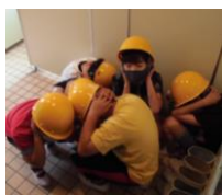
だんご虫のポーズで、身を屈める！

子どもたちの周りには危険がいっぱいです。登下校はもちろん、夏休み中でも様々な場面で正しい判断のもと行動し、自分の命を自分で守る力を身に付けてほしいです。