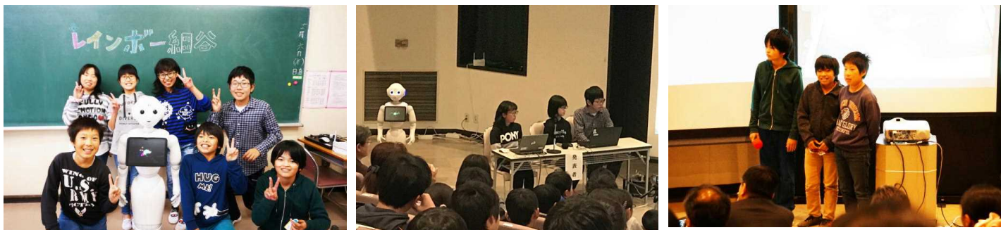
※細谷小学校は Pepper 社会貢献プログラムに参加しています。

12月15日、市のプログラミングコンテストがあり、6年生が「レインボー細谷」というチーム名で参加してきました。Pepper（ペッパー）を使ってのプログラミングで、プログラムタイトルは「細谷の安全を守るのに役立つ Pepper」です。細谷地区には交番がないので、Pepper に落とし物や事件・事故の受付、地域の見所案内など、交番の代わりにしてもらおうというものです。始まるまで、子どもたちはすごく緊張していましたが、始まってしまえば堂々としていて、Pepper との楽しいやりとりが多くの方々の笑いを誘っていました。新学習指導要領の先行実施で、学校にプログラミング学習が入ってきました。大人でも難しいのに、子どもたちはすぐ覚えてしまい、すごいです。