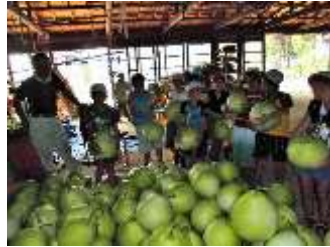
【かんぴょう農家見学】