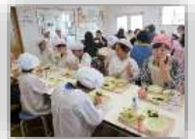
【ランチルーム給食】