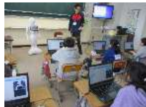
【プログラミング授業】