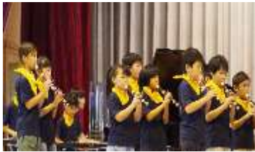
【下野市学校音楽祭：全校合奏】