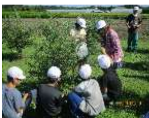
【全校ブルーベリー狩り】