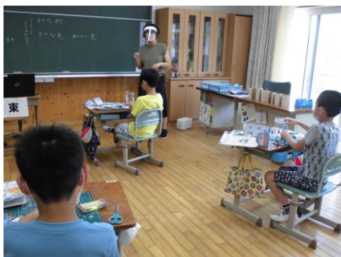
フェイスシールドをして授業すると、教師の表情からも伝わるものがあります