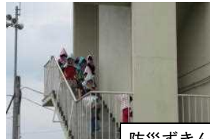
防災ずきんをかぶり避難

災害は、いつどこで何が起こるか分かりません。ご家庭においても、もしもの事を想定し、災害が発生したときの避難場所や持ち物等についての確認をお願いいたします。