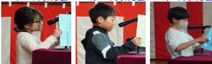
2年 代表児童 4年 代表児童 6年 代表児童