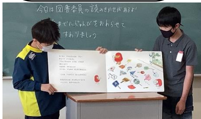
3-1 だるまちゃんんとんぐちゃん