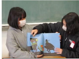
1-1 すてきな三にんぐみ