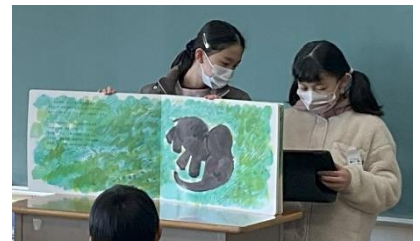
5-1 ぐるんぱのようちえん

きひと聞く人が聞こえやすいように、声の大きさに気をつけてよ読み聞かせができた。絵が見えやすいように工夫できた。