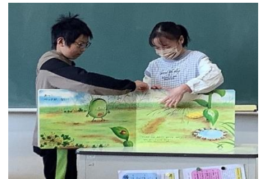
2-1 そらまめくんのベッド