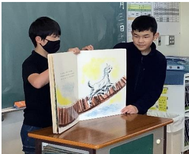
6-2 三びきのやぎのがらがらどん