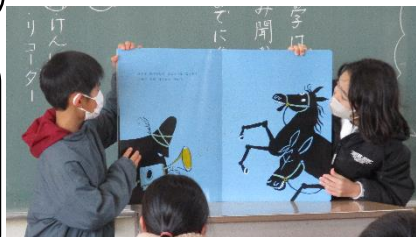
4-1 すてきな三にんぐみ

よねんせい よ き おこな 四年生の読み聞かせをやって、気づいたことは、みんながよく聞いてくれてうれしかったことです。自分のところによみきかせの人達が来たら、よく話をきこうと思いました。