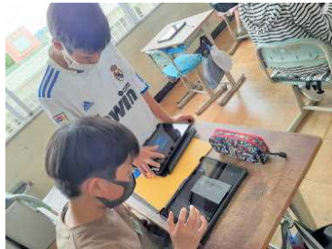
朝や業間の空いた時間に、友達と情報交換しながら、発表スライドの作成