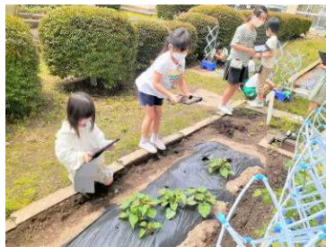
育てている野菜を写真に撮って、じっくり見ながら観察カードを作成