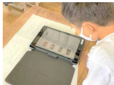
社会科の調べ学習で資料を検索