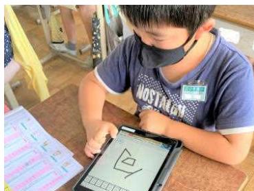
漢字練習で筆順を確認