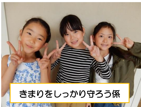
きまりをしっかり守ろう係

後期になり、新しい係活動がスタートしました。学級活動の時間に、“どんなことをしたら、クラスがもっと楽しくなるか。そのためには、どんな係があったら良いか”を話し合いました。最初は「うーん・・・」と悩んでいましたが、話し合っているうちにたくさんのアイデアが出てきました。「絵本の読み聞かせをする係」、「得意なスポーツを教える係」、「クラスの思い出を記録する係」、「困っている人を助けるお助け係」、「みんなを笑わせるお笑い係」・・・多すぎて全部は採用できませんでしたが、その中から10個の新しい係が誕生しました！これからの活動が楽しみです♪