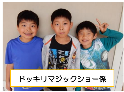
ドッキリマジックショー係