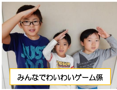
みんなでわいわいゲーム係