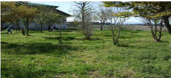
4月当初の蔵王の森

道徳「徳べえざくら（郷土愛）」の学習で、本校の“蔵王の森”のよさを見つけ出す活動につなげ実施しました。子どもたちも蔵王の森のよさを感じ取っていました。