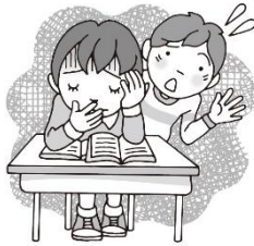
くあい わる 具合が悪いとき