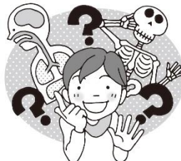
からだ 体について知りたいとき