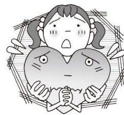
そうだん 相談やなやみがあるとき