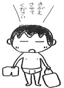
ふく 服がよごれたとき