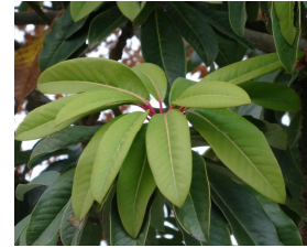
西門付 近のユ ズリハ