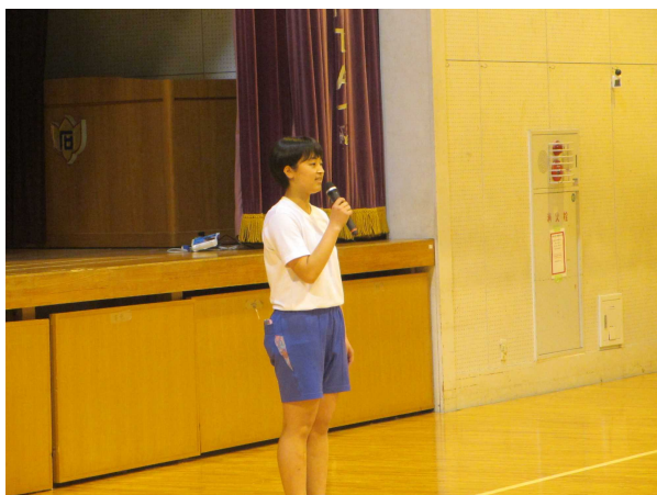
生活副委員長さんの話

今年度のいじめゼロ集会では「いじり」と「いじめ」の違いとは何なのかを中心にある中学校の例を見たり、武井先生のお話を聞いたりすることでお互い（友達）が嫌な気持ちにならないためにできることを一人一人深く考えることができました。