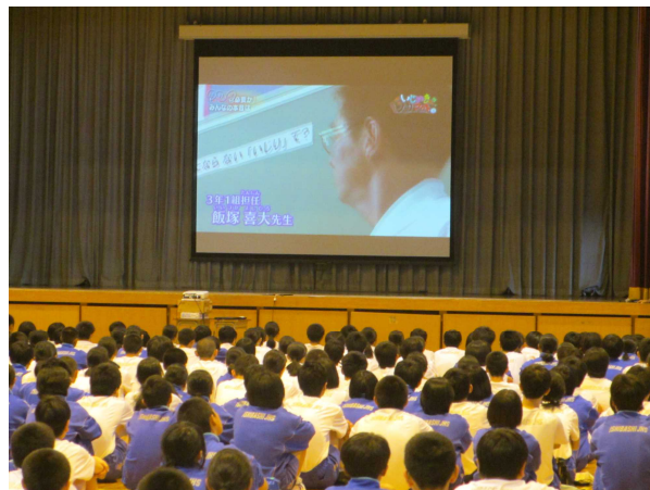
「いじり」は許されるのか 話合いの様子を見ました。