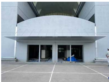
【生徒昇降口】 入り口に雨よけ用の庇が 取り付けられました。

改修工事の進捗状況は、現在予定どおり進んでおり、引っ越しも11月29日（金）に実施できる見込みです。12月2日（月）からは、新しくなった校舎で気持ちも新たに学校生活を送れると思います。教室は、1年生4階、2年生3階、3年生2階になります。12月13日（金）は学校開放日です。是非この機会にリニューアルされた校舎へ足を運んでいただければと思います。学校開放についての詳しい内容は、後日お知らせいたします。