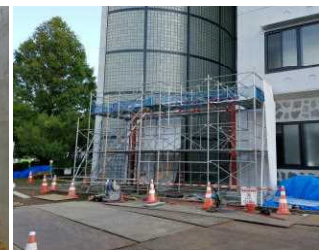
【来賓用玄関】 校舎北東に、新しく来賓 用玄関が設置されます。