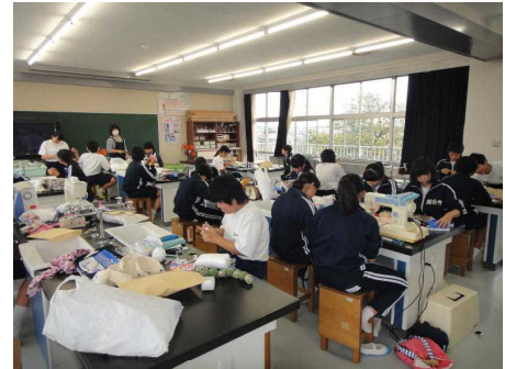
(手芸の活動の様子)

総合的な学習では、演劇や郷土料理、手話合唱、書道、和太鼓、モザイク壁画等々、生徒一人ひとりが、それぞれの課題に自主的に取り組んでいました。秋輝祭までの準備の様子を見ていても、よりよいものを作りあげようとする生徒と先生方の熱い思いが伝わってきました。