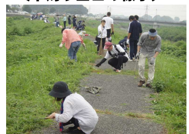
＜草刈り当日の様子＞

お陰様で、生徒たちの励みとなるとともに、補助金交付を間違いなく申請できるほど、サイクリングロードをきれいに整備することができました。この夏でも、特に暑さの厳しい日でありましたが、大変お世話になりました。