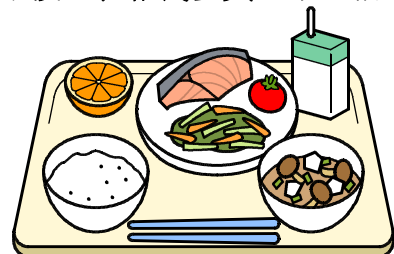
左 給食週間日本味めぐり 栃木県のメニュー