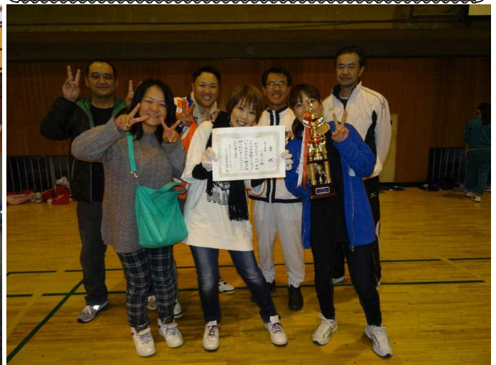
優勝した1年生保護者チーム