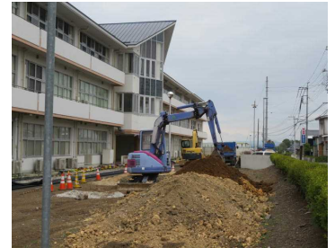
休業中に進んだ工事

まだまだ感染症の収束も定かではなく、心配な点が多々ありますが、学校は、国・県から発出される指示伝達を踏まえ、市教委ガイドラインを中心に市校長会との情報連携を図りながら、今後も様々な対策を構築して参ります。また、生徒には、体調管理や基本的な生活習慣、学習習慣等、自分自身の自己管理能力が高まるよう指導し、教職員と子供たちで協力して安全安心な学校作りを進めて参りたいと思います。今後ともご理解、ご協力をよろしくお願いいたします。