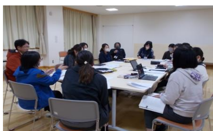
学習指導案検討会