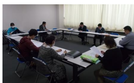
児童生徒指導部会(週1回)