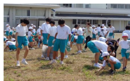
全校縦割班奉仕活動(除草作業)