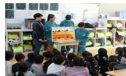
図書委員による読み聞かせ活動