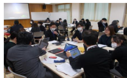
S&Uラボ事業(授業研究会)