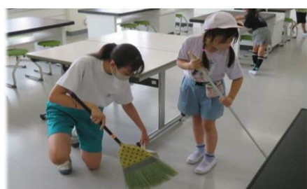
縦割班による清掃活動