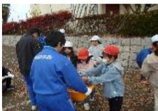
小中合同クリーン活動(石橋小)