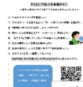
タイピング力の育成