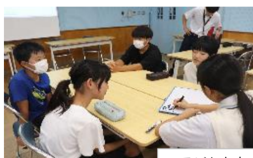
子ども未来プロジェクトの様子