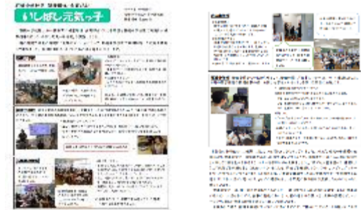
健康増進・食育だより