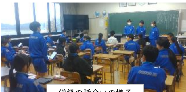
学級の話合いの様子