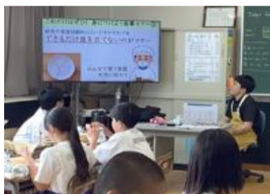
栄養士による呼びかけ