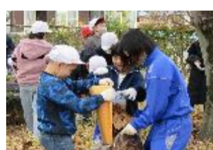
小中合同クリーン活動(石北小)