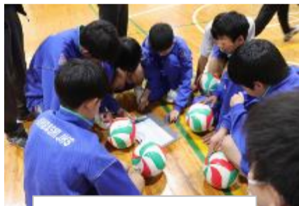
グループ活動の様子