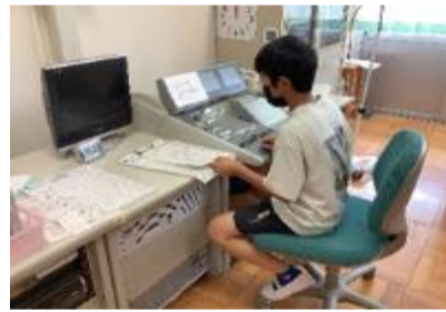
児童生徒による呼びかけ