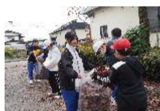
小中合同クリーン活動(古山小)