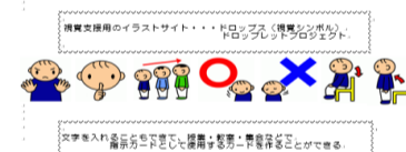
自閉症・情緒障がいの児童生徒の教育における合理的配慮