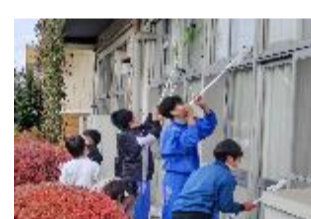
小中合同クリーン活動(細谷小)