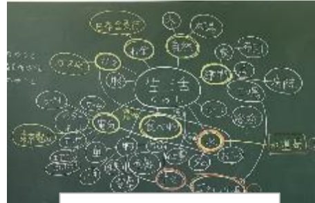
思考ツールの活用