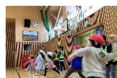
各校の取組の様子