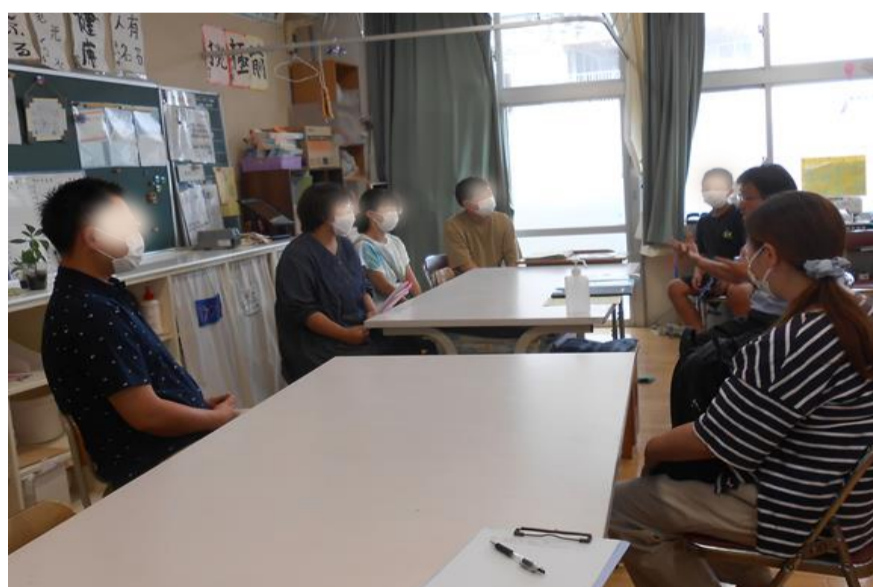
中学校特別支援学級担任による6年保護者説明