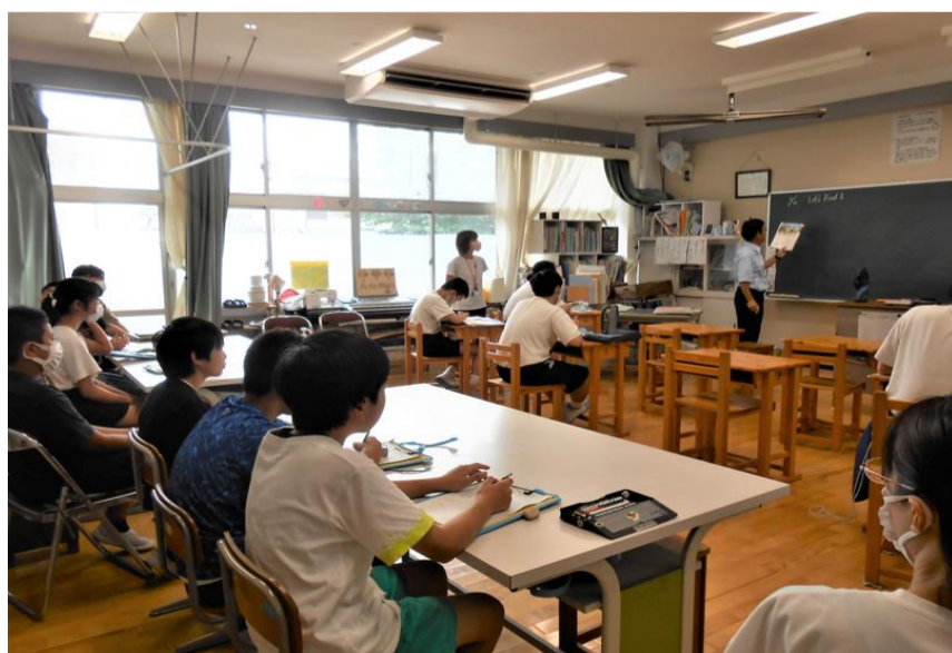
6年生児童と保護者の中学校授業参観