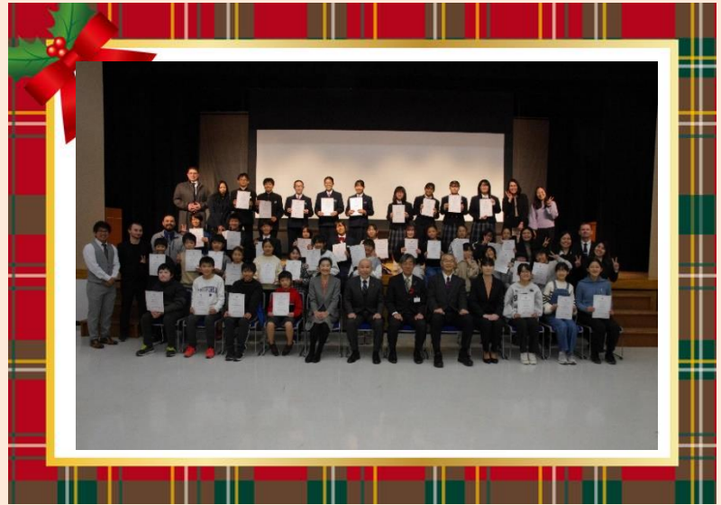
発表者全員での集合写真

国分寺地区を中心に、下野市の魅力や国分寺中学校の特徴などをクイズ形式で紹介しました。