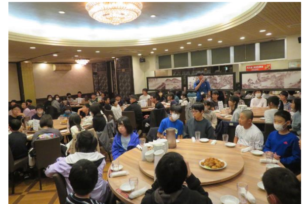
1日目夕食(横浜中華街)