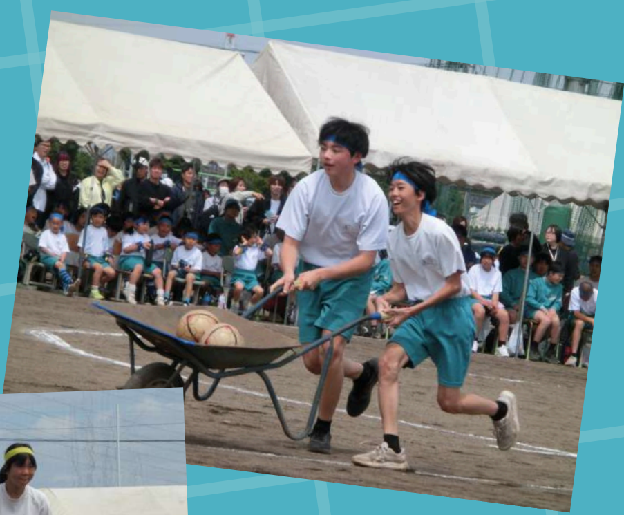
まじぎゅんぎゅんぎゅん 落としたら滅♡！