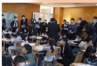
S&U研究授業(1年生道德)