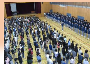
児童主催9年生ありがとうの会