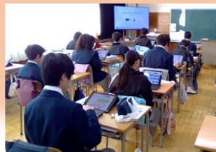
朝のタイピング練習