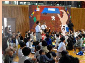
夕顔祭縦割り班交流